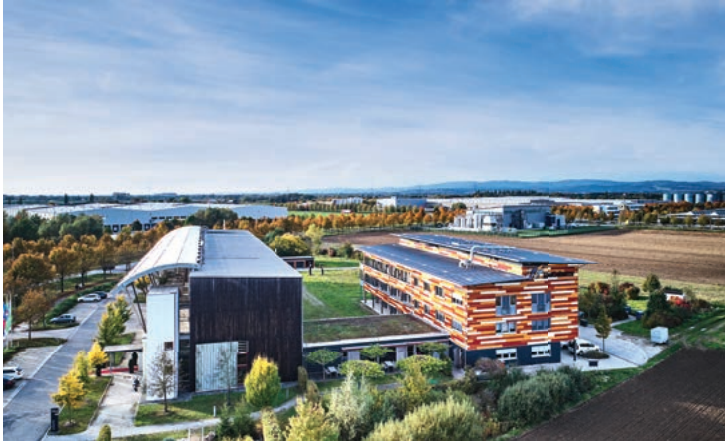
Start-up-Space im BioCubator, Bayerns einzigem Unternehmerzentrum für Nachwachsende Rohstoffe.

Die genauen Termine und Details zum Coaching sowie zur Prämierungsveranstaltung auf www.planb-wettbewerb.de