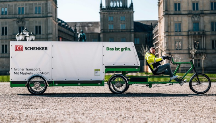
Cargo Bike XXL in Coburg