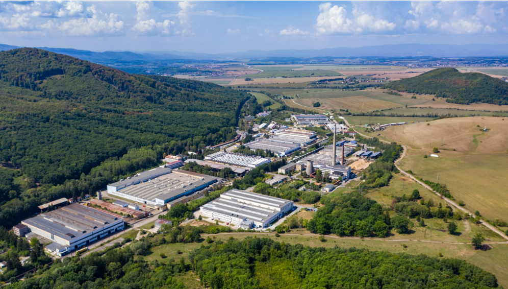
Abbildung: Industriegebiet Detva, Slowakei.