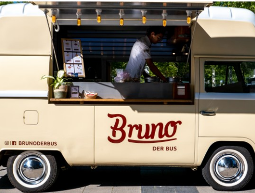
Food Truck