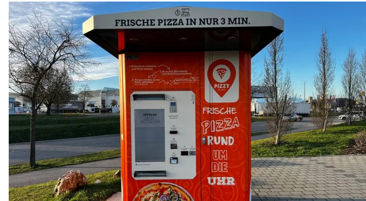
Pizza Back- und Verkaufsautomat