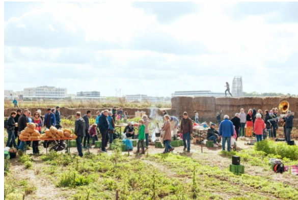
Freiluftsupermarkt München