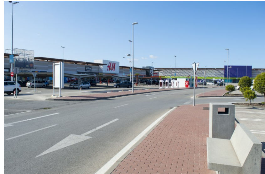
Einkaufsmarkt am Ortsrand