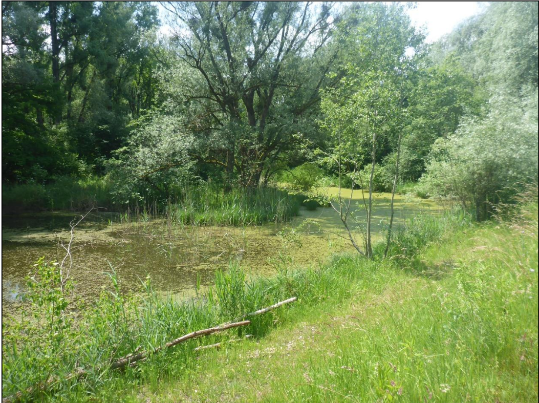
Abb. 3: Typischer Landschaftseindruck in der Innaue mit Altwaterzug und Auwald

Nachfolgend erfolgt die Bestandsbeschreibung für die näher zu beurteilenden Vogelarten (vgl. Kap. 4.1.1).